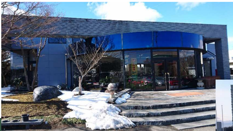
(株)フクイシ様の本社事務所です

また、汚れはどのようにして石材に付着して、どのように変化していくのか。それが、石材の表面にどのようにして残っていくのかを細部にわたって説明して頂きました。薬剤の効能だけを説明して実地テストを見せて売り込むだけの講習会も見受けられますが、これではお客様にきちんとした説明が出来ません。これからは、お客様が納得して頂いた業者だけが残っていく時代だと思います。ぜひ、営業の皆様も座学だけでも聞かれたほうが良いのではないのでしょうか。