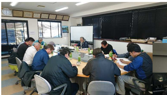
(株)フクイシ様の会議室で試験の最中です。